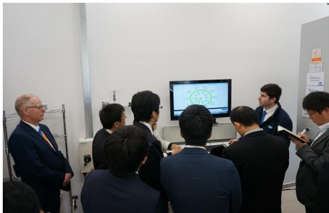
Aコース 訪問先の視察

2017年9月17日(日)から25日(月)まで、EMOショー(ドイツ・ハノーバー)の開催に併せ、Aコース:レニショー社(イギリス・ニューミルズ)、アーヘン工科大学(ドイツ・ハノーバー)、EMOショー、Bコース:ハイデンハイン社(ドイツ・トラウンロイト)、スイス連邦工科大学(スイス・チューリッヒ)EMOショーに若手技術者・研究者の派遣を行った。