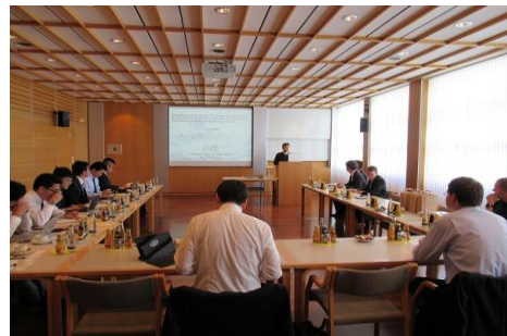
Bコース: 訪問先での技術交流会